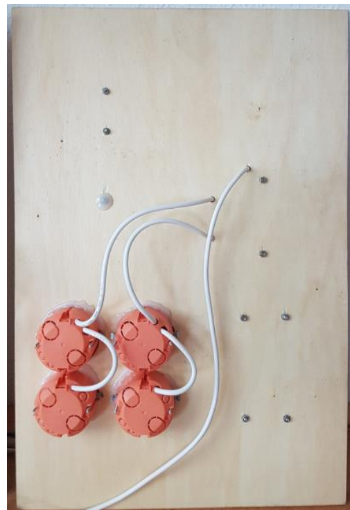
Modul 1, Rückseite