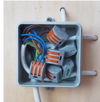
Modul 1, Verdrahtung

Modul 2 enthält eine konventionell aufgebaute funktionsfähige Wechselschaltung sowie drei E27-Fassungen für Leuchtmittel.