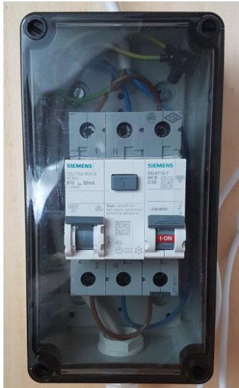
Modul 1, LS und RCD