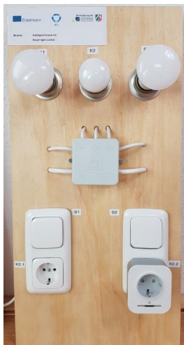
Modul 2, Vorderseite mit 2 Phillips Hue Leuchtmitteln und smarter Steckdose

Das Leuchtmittel E2 wird über eine konventionelle Wechselschaltung mit den Wechselschaltern S1 und S2 geschaltet. E1 und E3 dienen der Aufnahme von Phillips Hue Leuchtmitteln und sind ohne Schalter direkt mit der Phase L1 verbunden.