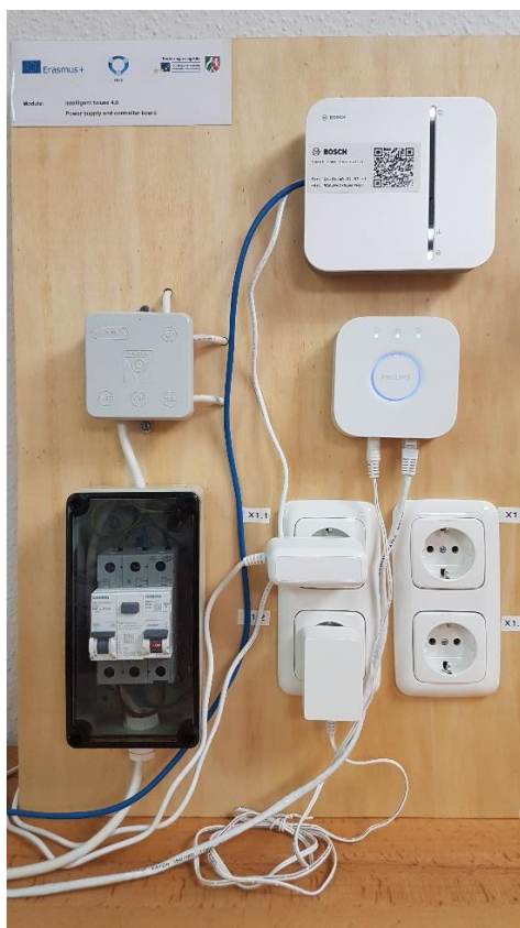
Modul 1, Vorderseite Mit Bosch Smart Home Controller und Phillips Hue Controller

Aufbau und Verkabelung sind in den Abbildungen unten dargestellt.